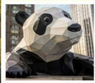
ห้าง IFS แพนด้าป็นตึก