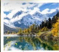
ปี้เผิงโกว