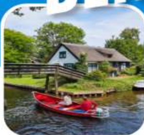
ท่องเที่ยวครบ ตลอดการเดินทาง