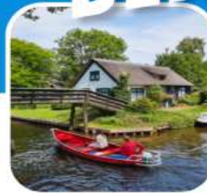
ห้องเที่ยวครบ ตลอดการเดินทาง