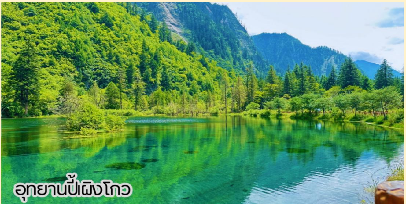
อุทยานπίงผิงโกว

เช้า : | รับประทานอาหารเช้า ณ ห้องอาหารโรงแรม (มื้อที่ 1 )