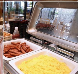
Asia Narita Hotel