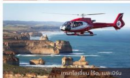
เกรทไฮลैंด ไรโร, เมลเบิร์น