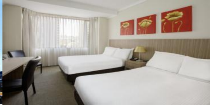
(โรงแรมย่านกลางเมือง ใกล้แหล่งช้อปปิ้ง เดินทางสะดวก) *รูปภาพเพื่อการโฆษณา*