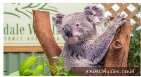
สวนสัตว์พื้นเมือง, ซิดนีย์