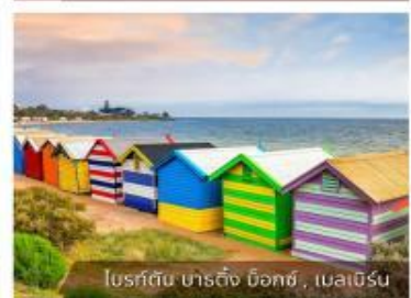
โบสถ์สีรุ้ง บาร์ติง บ็อกซ์, เมลเบิร์น