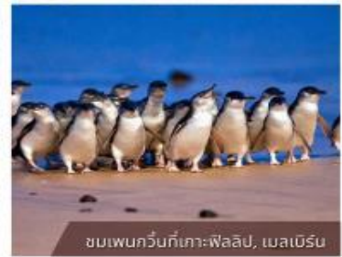
ชมเพนกวินที่เกาะฟิลลิป, เมลเบิร์น