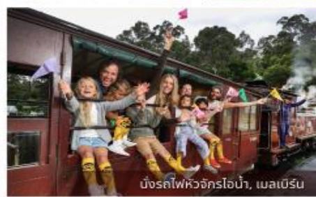
บึงรถไฟหัวจักรไอน้ำ, เมลเบิร์น