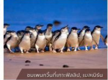
ชมเพนกวินที่เกาะฟิลลิป, เมลเบิร์น