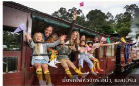
บั้งรถไฟหัวจักรไอน้ำ, เมลเบิร์น