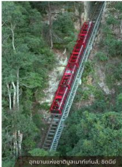
อุทยานแห่งชาติบลูเมาท์เทนส์, ซิดนีย์