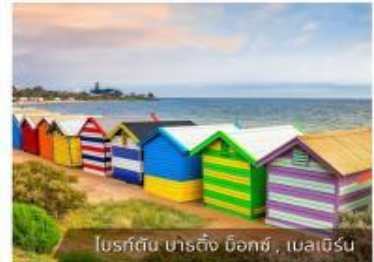
โบสถ์สีน้ำเงิน บาร์คิง น็อกซ์, เมลเบิร์น