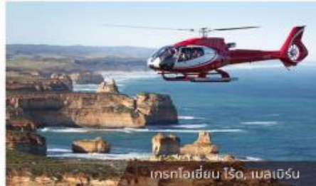
เกรทไฮลิเยน ไร, เมลเบิร์น