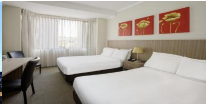
(โรงแรมย่านกลางเมือง ใกล้แหล่งช้อปปิ้ง เดินทางสะดวก) *รูปภาพเพื่อการโฆษณา*

วันที่หก ซิดนีย์ – อุทยานแห่งชาติบลูเมาท์เทนส์ – SCENICWORLD – เขาสามยอด – ช้อปปิ้งย่านใจกลางเมือง - ห้าง Q.V.B.