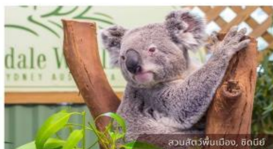
สวนสัตว์พื้นเมือง, ซิดนีย์