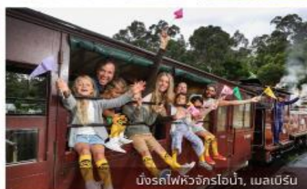
มิ่งรถไฟหัวจักรไอน้ำ, เมลเบิร์น