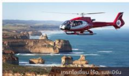
เกสรโฮเชียน ไร, เมลเบิร์น