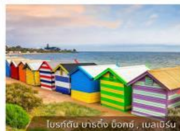
โบสถ์สี นาร์ติง น็อกซ์, เมลเบิร์น