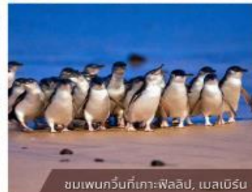
ชมเพนกวินที่เกาะฟิลลิป, เมลเบิร์น