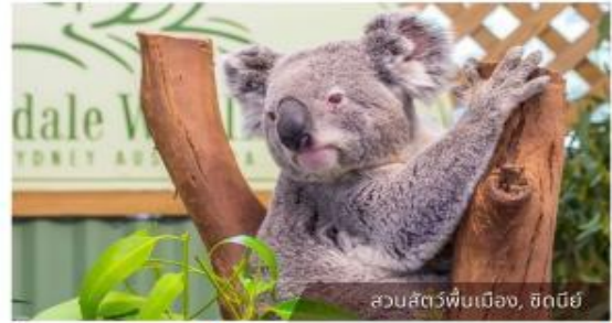
สวนสัตว์พื้นเมือง, ซิดนีย์