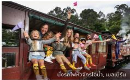
มิงครไฟว์จักรไอน้ำ, เมลเบิร์น