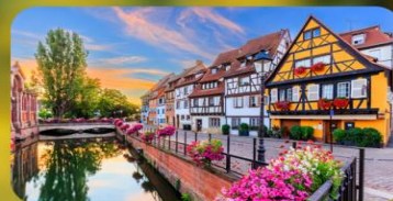
ดินแดนแห่งเทพนิยาย กอลมาร์