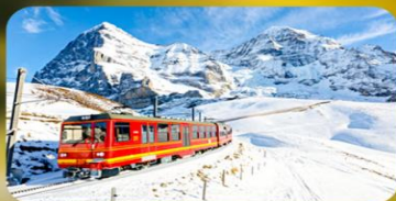
พิชิตยอดเขาจุงเฟรา

พักที่ Pullman Paris Tour Eiffel Hotel พิเศษ !!! ห้องระเบียงวิวหอไอเฟล หรือระดับเทียบเท่า