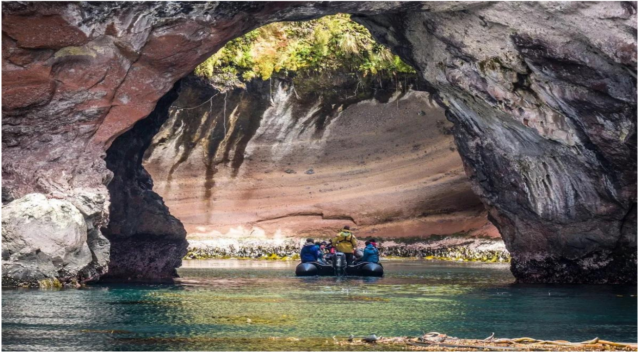
3 มกราคม 2570 At the SEA

At the SEA อีสระให้ท่านพักผ่อนบนเรือสำราญหรูตามตามอัชฌาศัย ท่านสามารถใช้ประโยชน์จากบริการและกิจกรรมมากมายบนเรือได้อย่างเต็มที่ ผ่อนคลายในสปาหรือออกกำลังกายในฟิตเนสเซ็นเตอร์ ขึ้นอยู่กับฤดูกาล ท่านอาจเพลิดเพลินกับการว่ายน้ำในสระหรืออาบแดด การเดินทางโดยไม่แวะจอดทำเรื่อนี้ยังเป็นโอกาสที่จะได้เข้าร่วมการประชุมหรือการแสดงต่างๆ บนเรือ ขึ้นอยู่กับกิจกรรมที่น่าเสนอ หรือช้อปปิ้งในบูติก สำหรับท่านที่ชื่นชอบทะเลเปิด ท่านสามารถขึ้นไปบนดาดฟ้าเรือ เพื่อชื่นชมความงดงามของคลื่น และอาจโชคดีได้เห็นสัตว์ทะเลต่างๆ ช่วงเวลาที่น่าประทับใจ ผสมผสานความสะดวกสบาย การพักผ่อน และความบันเทิง ตลอดระยะเวลาที่ท่านอยู่กลางทะเล