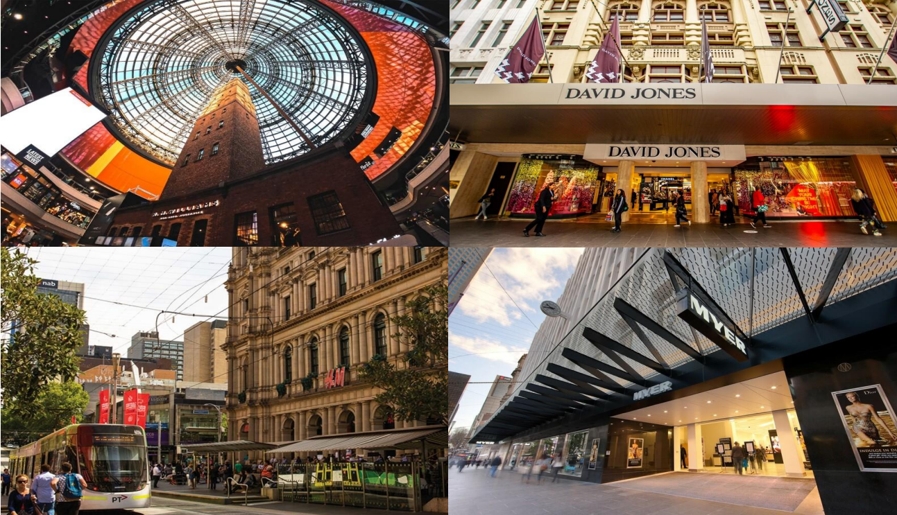
“อีสาระให้ท่านพักผ่อน หรือ ท่องเที่ยวตามอัธยาศัยในเมืองเมลเบิร์น”

ซึ่งในย่านใจกลางเมืองเมลเบิร์น เต็มไปด้วยห้างสรรพสินค้า อาทิเช่น Myer / David Jones / Emporium / Melbourne Central มีสินค้ามากมายทั้งสำหรับผู้ชาย ผู้หญิง เสื้อผ้า เครื่องแต่งกาย น้ำหอม ผลิตภัณฑ์แฟชั่น กระเป๋า สินค้าแบรนด์เนมต่างๆมากมาย หรือซูเปอร์มาร์เก็ตเช่น Woolworths / Coles ซึ่งมีสินค้าให้ท่านเลือกซื้อหลากหลาย อีกทั้งบริเวณย่านใจกลางเมืองยังเป็นที่ตั้งของคาเฟ่ ร้านกาแฟ ร้านอาหาร แกลลอรี่ ให้ท่านได้มีเวลาพักผ่อนเดินเล่นตามอัธยาศัย