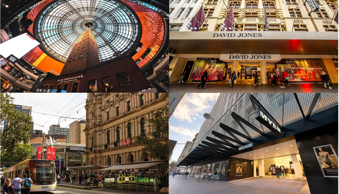
“อีระให้ท่านพักผ่อน หรือ ท่องเที่ยวตามอัธยาศัยในเมืองเมลเบิร์น”

ซึ่งในย่านใจกลางเมืองเมลเบิร์น เต็มไปด้วยห้างสรรพสินค้า อาทิเช่น Myer / David Jones / Emporium / Melbourne Central มีสินค้ามากมายทั้งสำหรับผู้ชาย ผู้หญิง เสื้อผ้า เครื่องแต่งกาย น้ำหอม ผลิตภัณฑ์แฟชั่น กระเป๋า สินค้าแบรนด์เนมต่างๆมากมาย หรือซูเปอร์มาร์เก็ตเช่น Woolworths / Coles ซึ่งมีสินค้าให้ท่านเลือกซื้อหลากหลาย อีกทั้งบริเวณย่านใจกลางเมืองยังเป็นที่ตั้งของคาเฟ่ ร้านกาแฟ ร้านอาหาร แกลลอรี่ ให้ท่านได้มีเวลาพักผ่อนเดินเล่นตามอัธยาศัย