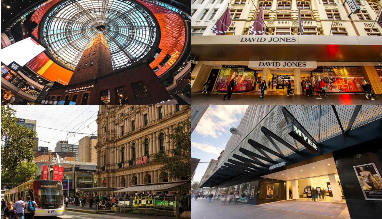
“อีสาระให้ท่านพักผ่อน หรือ ท่องเที่ยวตามอัธยาศัยในเมืองเมลเบิร์น”

ซึ่งในย่านใจกลางเมืองเมลเบิร์น เต็มไปด้วยห้างสรรพสินค้า อาทิเช่น Myer / David Jones / Emporium / Melbourne Central มีสินค้ามากมายทั้งสำหรับผู้ชาย ผู้หญิง เสื้อผ้า เครื่องแต่งกาย น้ำหอม ผลิตภัณฑ์แฟชั่น กระเป๋า สินค้าแบรนด์เนมต่างๆมากมาย หรือซูเปอร์มาร์เก็ตเช่น Woolworths / Coles ซึ่งมีสินค้าให้ท่านเลือกซื้อหลากหลาย อีกทั้งบริเวณย่านใจกลางเมืองยังเป็นที่ตั้งของคาเฟ่ ร้านกาแฟ ร้านอาหาร แกลลอรี่ ให้ท่านได้มีเวลาพักผ่อนเดินเล่นตามอัธยาศัย