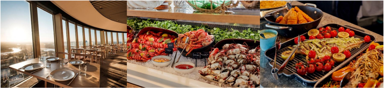
* รูปเพื่อการโฆษณาเท่านั้น *

สถาปัตยกรรมการตกแต่งที่หรูหราสวยงาม ห้างWestfield Shopping Center มีลักษณะเป็นศูนย์การค้าขนาดใหญ่ ตั้งอยู่ที่ซิดนีย์ทาวเวอร์ ภายในมีร้านสินค้าแบรนด์เนมต่าง ๆ มากมาย ใกล้กันยังมีห้างMyer และDavid Jones ศูนย์การค้าชื่อดังของออสเตรเลีย ซึ่งมีจำหน่ายเสื้อผ้า เครื่องประดับ รองเท้า เครื่องสำอางค์ น้ำหอม และสินค้าอื่น ๆ มากมาย คำ นำท่านขึ้นหอคอยซิดนีย์ พร้อมรับประทานอาหาร แบบบุฟเฟต์นานาชาติ SKYFEAST AT SYDNEY TOWER RESTAURANT พร้อมชมวิวของนครซิดนีย์อันสวยงามในยามเย็น