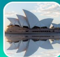
ซิดนีย์, โอเปร่าเฮ้าส์