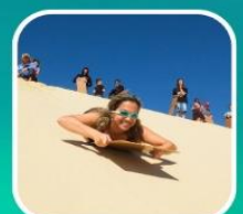
เล่นกระดานทรายจากยอดเนินทรายสูงชัน