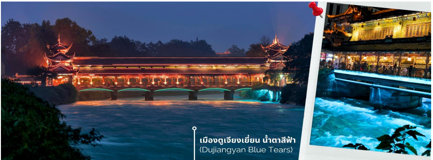
เมืองตู่เจียงเยียน น้ำตาสีฟ้า (Dujiangyan Blue Tears)

นำท่านเดินทางสู่ เมืองโบราณตู่เจียงเยียน เมืองนี้เป็นแหล่งโครงการชลประทานต้นแบบสมัยโบราณที่มีประวัติยาวนานมากกว่า 2,274 ปี ตั้งอยู่ในมณฑลเสฉวน เพื่อแก้ปัญหาน้ำท่วมในพื้นที่ลุ่มแม่น้ำ Minjiang และเพื่อจัดสรรน้ำสำหรับการเกษตรนี้ โดยการสร้างควบคุมน้ำที่ไม่ต้องพึ่งพาเขื่อนชลประทานนี้ยังคงใช้งานได้ดีจนถึงปัจจุบันและได้รับการยกย่องให้เป็นหนึ่งในมรดกโลกโดยองค์การยูเนสโก และยังเป็นต้นแบบของภูมิปัญญาด้านการจัดการทรัพยากรน้ำของจีน ไม่เพียงแต่ได้รับการ ยกย่องในด้านวิศวกรรมอันชาญฉลาดและประโยชน์ต่อระบบนิเวศเท่านั้นแต่ยังเป็นที่ยังเป็นที่รู้จักในฐานะสถานที่ชมความงามของปรากฏการณ์ “น้ำตาสีฟ้า” ที่ตราตรึงใจนักท่องเที่ยวทั่วโลก ให้ท่านเข้าชม ธารน้ำสีฟ้า Blue Tears เป็นจุดท่องเที่ยวที่เต็มไปด้วยมนต์เสน่ห์แห่งสถาปัตยกรรมจีนแบบดั้งเดิม ทอดยาวข้ามแม่น้ำ กลายเป็นภาพอันน่าประทับใจยามค่ำคืนเมื่อแสงไฟตกแต่งส่องสะท้อนน้ำให้กลายเป็นสีฟ้าเงิน ดูสวยงามราวกับโลกแห่งจินตนาการ ความพิเศษอยู่ที่การจัดไฟอย่างประณีต ซึ่งช่วยเน้นให้สะพานมีชีวิตชีวาท่ามกลางบรรยากาศยามค่ำคืนที่รายรอบไปด้วยภูเขาและต้นไม้เพิ่มความรู้สึกสงบและสดชื่น เมื่อเดินข้ามสะพานนี้แล้วได้สัมผัสกับบรรยากาศรอบ ๆ มีแสงไฟที่ส่องประกายลงสู่ผืนน้ำจึงเป็นประสบการณ์ที่ทำให้รู้สึกผ่อนคลายและเต็มไปด้วยความประทับใจที่ยากจะลืม