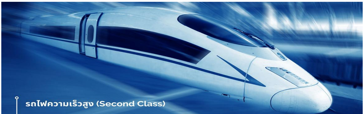
รถไฟความเร็วสูง (Second Class)

จากนั้นนำท่านเดินทางสู่ เมืองจิวจ้ายโกว โดยรถไฟไคซ (ประมาณ 2 ชั่วโมง)เป็นพื้นที่อนุรักษ์ธรรมชาติทางตอนเหนือของมณฑลเสฉวน ประเทศสาธารณรัฐประชาชนจีน มีชื่อเสียงจากน้ำตกหลายระดับชั้นและทะเลสาบที่มีสีสังคนดงาม และได้รับการประกาศให้เป็นมรดกโลกเมื่อปี พ.ศ. 2535 ตั้งอยู่ทางตอนใต้สุดของเทือกเขาหิมินซาน ห่างจากเมืองเฉิงตูไปทางเหนือ 330 กิโลเมตร