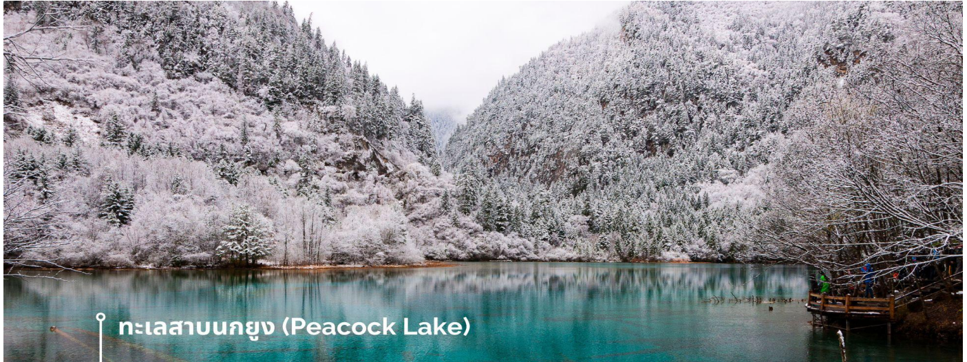
ทะเลสาบนกยูง (Peacock Lake)

ทะเลสาบมีรูปร่างคล้ายกับนกยูง จึงเป็นที่มาของชื่อ แม้พื้นที่จะไม่กว้างมากนัก มีความยาวเพียงแค่ 310 เมตร แต่ความสวยงามของที่นี่ก็ไม่แพ้จุดอื่นๆ ของอุทยานฯ เพราะน้ำในทะเลสาบเป็นสีฟ้าใสราวกับคริสตัล ไล่เฉดฟ้าอ่อน ฟ้าอมเขียว และน้ำเงินตามความตื้นลึกของน้ำ ในช่วงฤดูหนาวต้นไม้จะถูกปกคลุมไปด้วยหิมะสีขาวนวล ดูแล้วคล้ายนกยูงกำลังจ้ำจี้ล หากมาในช่วงที่มีแสงแดดจะมองเห็นความงดงามได้ทั่วบริเวณ