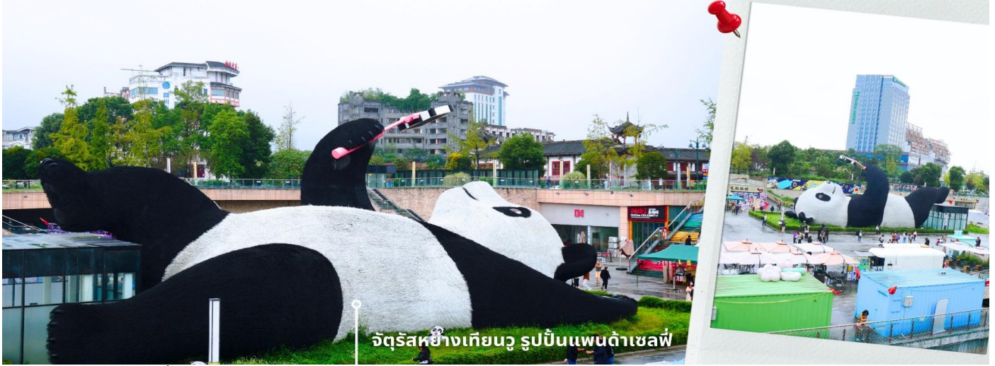
จตุรัสหยางเทียนวอ รูปปั้นแพนด้าเซลฟี่

อิสระเดินชมถ่ายภาพ รูปปั้นแพนด้าเซลฟี่ ตามอัยาศัย ที่นี่เป็นจุดเช็คอินที่เหมาะสมสำหรับทุกเพศทุกวัย หากคุณกำลังมองหาสถานที่ท่องเที่ยวใหม่ๆ ที่เต็มไปด้วย ความทรงจำดีๆ จตุรัสหยางเทียนวอ คือคำตอบที่สมบูรณ์แบบ