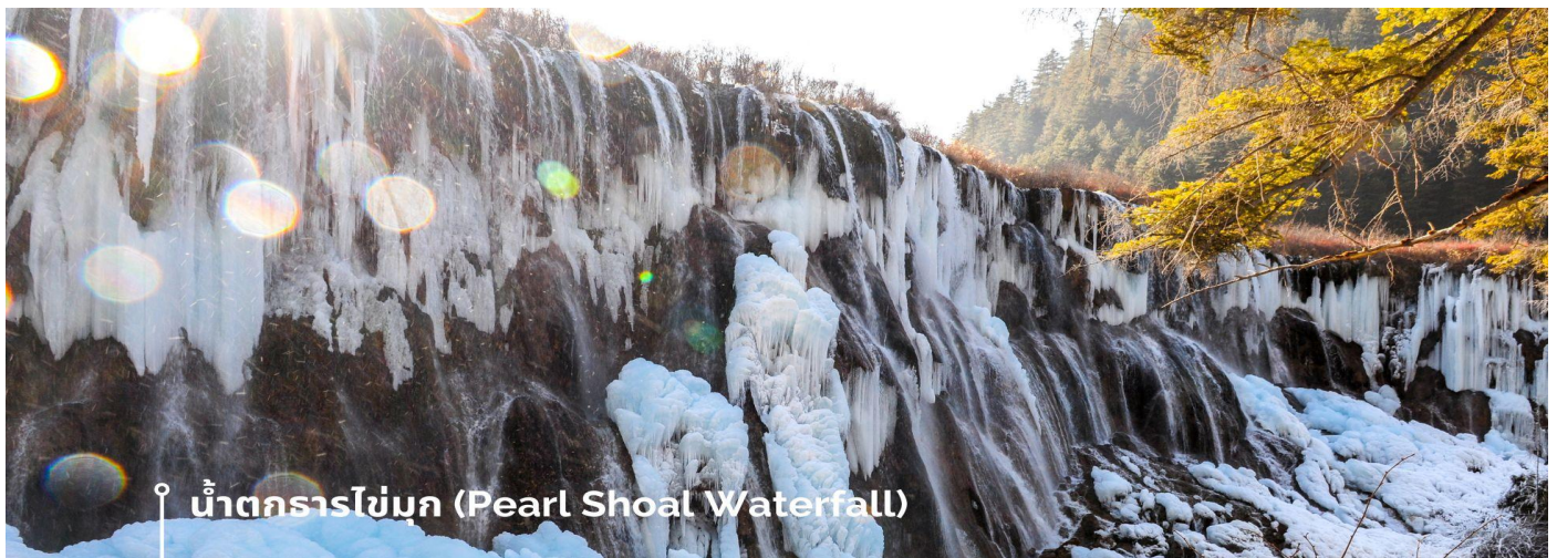
น้ำตกธารไข่มุก (Pearl Shoal Waterfall)

หรือ น้ำตกนุริออลาง (Nuo Ri Lang Waterfall) ถือเป็นน้ำตกที่ใหญ่ที่สุดในจิวจ้ายโกว มีความสูง 40 เมตร กว้าง 310 เมตร เกิดจากหินปูนที่แข็งตัวจนกลายเป็นรูปทรงคล้ายพัด มีสายธารน้อยใหญ่ไหลผ่านลดหลั่นทอดยาวผ่านชั้นหินต่างๆ ยามมีแสงแดดสาดส่องตกลงกระทบผืนน้ำจะส่องประกายราวกับเส้นไข่มุกเหมือนชื่อน้ำตก บางครั้งอาจได้เห็นสายรุ้งจากแสงแดดที่สะท้อนกับละอองน้ำอีกด้วย หากได้มาในช่วงฤดูหนาว ก็จะได้เห็นหิมะเกาะตามต้นไม้ โขดหิน และถ้าอากาศหนาวมากๆ น้ำที่น้ำตกก็จะกลายเป็นน้ำแข็ง กลายเป็นประติมากรรมจากธรรมชาติที่สวยงาม