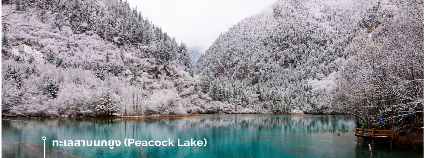
ทะเลสาบนกยูง (Peacock Lake)

ทะเลสาบมีรูปร่างคล้ายกับนกยูง จึงเป็นที่มาของชื่อ แม้พื้นที่จะไม่กว้างมากนัก มีความยาวเพียงแค่ 310 เมตร แต่ความสวยงามของที่นี่ก็ไม่แพ้จุดอื่นๆ ของอุทยานฯ เพราะน้ำในทะเลสาบเป็นสีฟ้าใสราวกับคริสตัล โผล่แดดฟ้าอ่อน ฟ้าอมเขียว และน้ำเงินตามความตื้นลึกของน้ำ ในช่วงฤดูหนาวต้นไม้จะถูกปกคลุมไปด้วยหิมะสีขาวนวล ดูแล้วคล้ายนกยูงกำลังจ้ำจี้ หากมาในช่วงที่มีแสงแดดจะมองเห็นความงดงามได้ทั่วบริเวณ