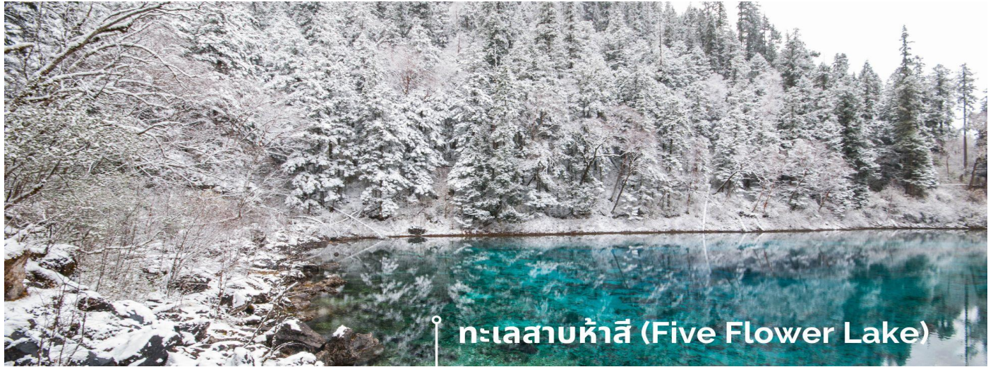
ทะเลสาบห้าสี (Five Flower Lake)

ให้เกิดสีสันต่างๆ นี้มาจากการสะสมของแร่ธาตุ และพีชน้ำชนิดต่างๆ โดยจะมีสีสันแตกต่างกันไปตามฤดูกาลและช่วงเวลา ยิ่งถ้ามาในช่วงฤดูหนาว ต้นไม้ริมทะเลสาบจะเต็มไปด้วยหิมะสีขาวตัดกับสีของทะเลสาบ ดูสวยงามแปลกตา