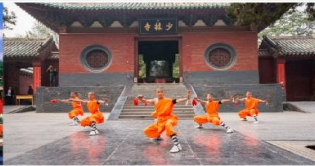
โชว์แสดงกังฟู