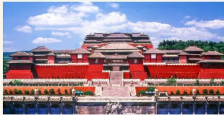
เมืองถ่ายภาพยนตร์