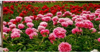
สวนดอกโบตั๋น