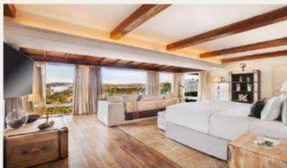
Gran Meliá Iguazú Argentina Side