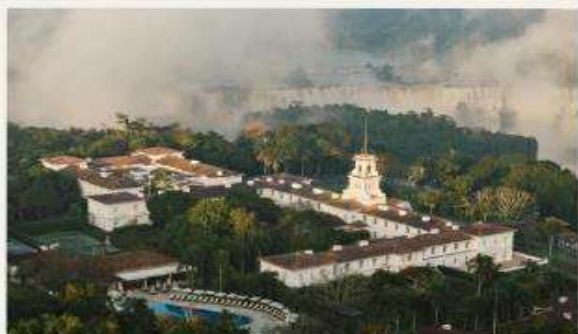
Hotel das Cataratas, A Belmond Hotel