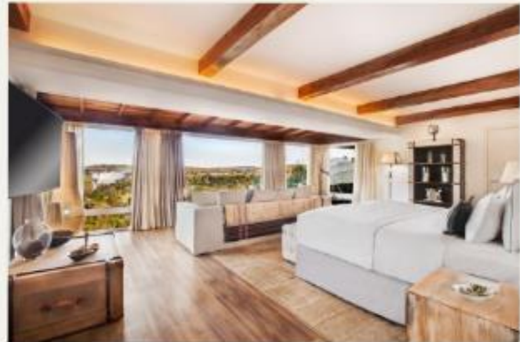
Gran Meliá Iguazú Argentina Side