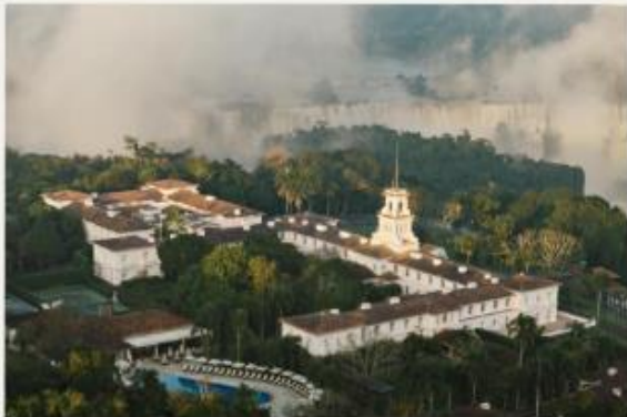
Hotel das Cataratas, A Belmond Hotel