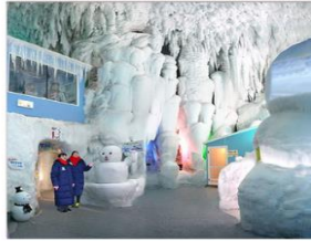
พิพิธภัณฑ์น้ำแข็ง