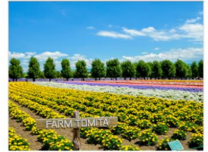
ทุ่งลาเวนเดอร์โทมิตะ