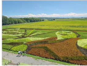
ศิลปะบนทุ่งนา