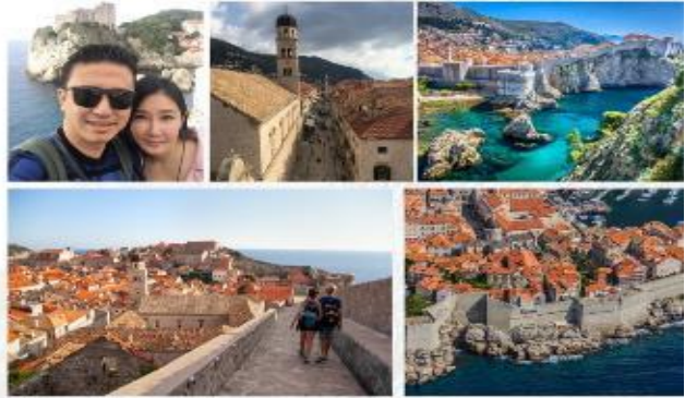
คำพูดว่า!!! ฉันทนถ่ายเมืองเก่าจากถ่ายที่ "Game of Throne" Must visit place in Dubrovnik