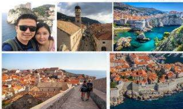
ห้ามพลาด!!! เว้นแต่ขี้ขลาดเมืองเก่าจากซีรีส์ "Game of Throne" Must visit place in Dubrovnik