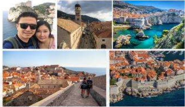
ห้ามพลาด!!! 租金บนกำแพงเมืองเก่าจากซีรีส์ "Game of Throne" Must visit place in Dubrovnik