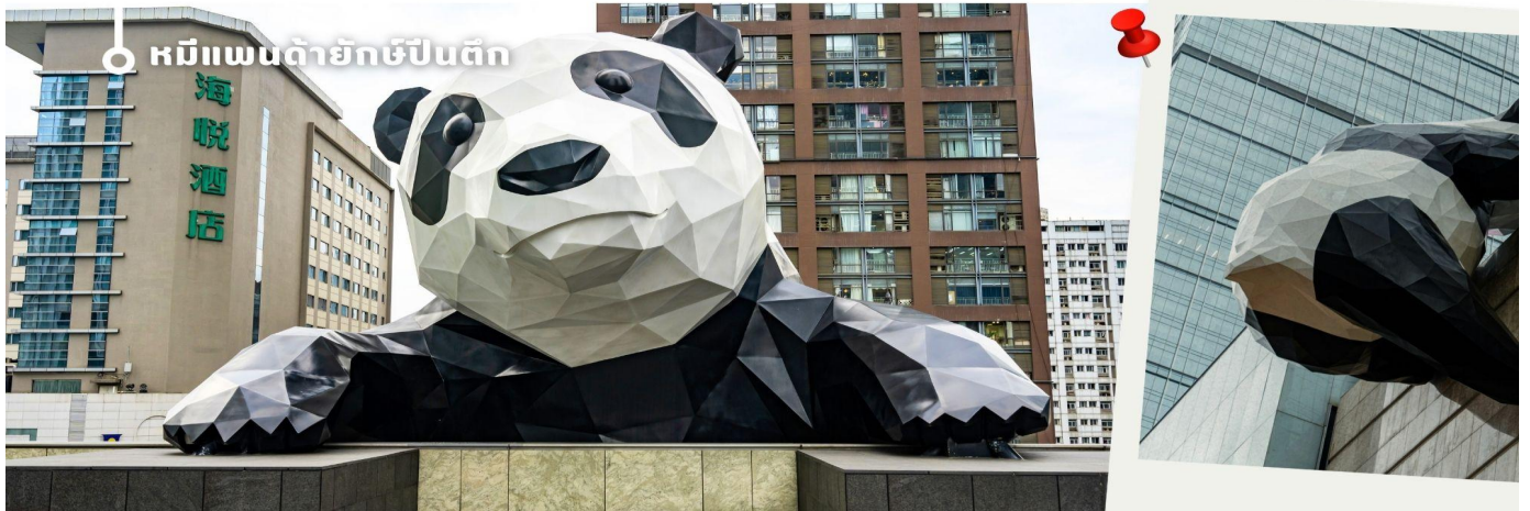
หมีแพนด้ายักษ์ปักกิ่ง

จากนั้นให้ท่านให้อิสระกับการเลือกซื้อสินค้าของฝากที่ ถนนไท่กุ่หลี่ และ ถนนชุนซีลู่ ในย่านนี้เป็นถนนโบราณ ในอดีตเคยเป็นโรงงานผลิตผ้าไหมที่ใหญ่ที่สุดในจีน ปัจจุบันได้เปลี่ยนเป็นถนนช้อปปิ้งแหล่งสวรรค์ของนักท่องเที่ยว เป็นถนนคนเดินมีห้างสรรพสินค้าชื่อดัง มีร้านค้ามากกว่า 700 ร้านค้าที่เต็มไปด้วยสินค้าต่าง ๆ ทั้งร้านค้าแฟชั่น ร้านอาหารและโรงแรมนานาชาติมากมายซึ่งเป็นที่เที่ยวเชิงดูที่มีการเชื่อมต่อทางวัฒนธรรมท้องถิ่นที่เป็นแหล่งช้อปปิ้งและเป็นแหล่งร้านอาหารที่อร่อยต่าง ๆ มากมาย ซึ่งเป็นสถานที่เที่ยวของเฉิงตูที่ทำให้เพลิดเพลินกับสินค้าแบรนด์เนมและแบรนด์จีน เพื่อให้นักท่องเที่ยวได้เลือกซื้อตามอิสระ