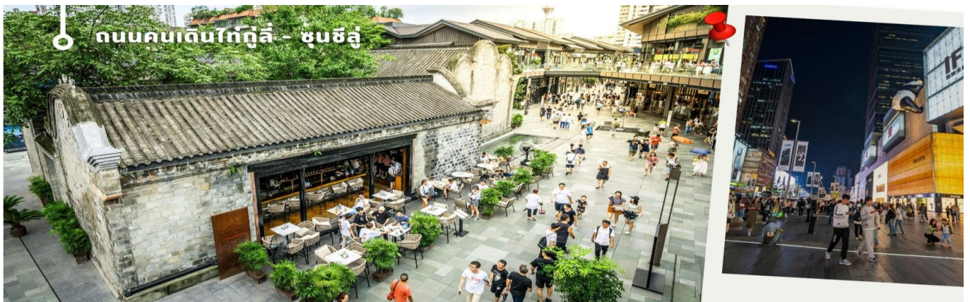
ถนนคนเดินไท่กุ่หลี่ - ชุนซีลู่

จากนั้นให้ท่านให้อิสระกับการเลือกซื้อสินค้าของฝากที่ ถนนไท่กุ่หลี่ และ ถนนชุนซีลู่ ในย่านนี้เป็นถนนโบราณ ในอดีตเคยเป็นโรงงานผลิตผ้าไหมที่ใหญ่ที่สุดในจีน ปัจจุบันได้เปลี่ยนเป็นถนนช้อปปิ้งแหล่งสวรรค์ของนักท่องเที่ยว เป็นถนนคนเดินมีห้างสรรพสินค้าชื่อดัง มีร้านค้ามากกว่า 700 ร้านค้าที่เต็มไปด้วยสินค้าต่าง ๆ ทั้งร้านค้าแฟชั่น ร้านอาหารและโรงแรมนานาชาติมากมายซึ่งเป็นที่เที่ยวเชิงดูที่มีการเชื่อมต่อทางวัฒนธรรมท้องถิ่นที่เป็นแหล่งช้อปปิ้งและเป็นแหล่งร้านอาหารที่อร่อยต่าง ๆ มากมาย ซึ่งเป็นสถานที่เที่ยวของเฉิงตูที่ทำให้เพลิดเพลินกับสินค้าแบรนด์เนมและแบรนด์จีน เพื่อให้นักท่องเที่ยวได้เลือกซื้อตามอิสระ