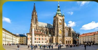
เข้าชม 2 ปราสาท ปราก และเซินบรุนน์