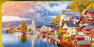
การันตีที่พัก Hallstatt / St. Wolfgang หรือริมทะเลสาบ 1 คืน