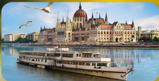
ล่องเรือแม่น้ำดาบูบ พร้อมจิบแชมเปญ