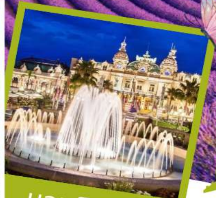
มอนติคาร์โร