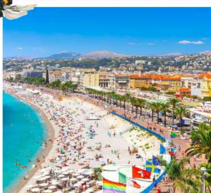
เพรนซีริเวียร์่า