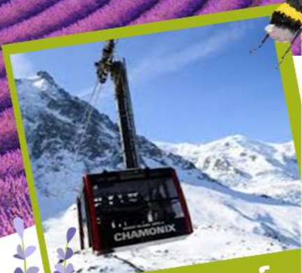
มองค้บลังค์