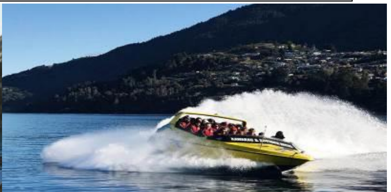
BW PERFECT NZ S+N 12D 10N JUL-NOV 2026 - QF