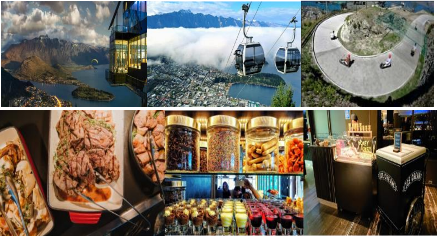
นำท่านเข้าสู่ที่พัก MERCURE HOTEL/RYDGES QUEENSTOWN HOTEL หรือเทียบเท่า 4* (คืนที่ 5)