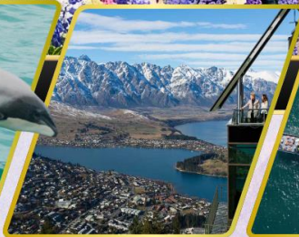
ยอดเขานีออบส์พิค