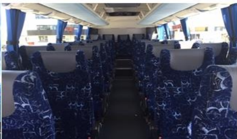
* ลูกค้าจำนวน 15 ท่านขึ้นไป ใช้รถบัสขนาด 30 - 35 ที่นั่ง*