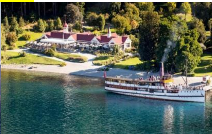
กลางวัน รับประทานอาหารกลางวัน บาร์บีคิว ณ วอลเตอร์พีคฟาร์ม