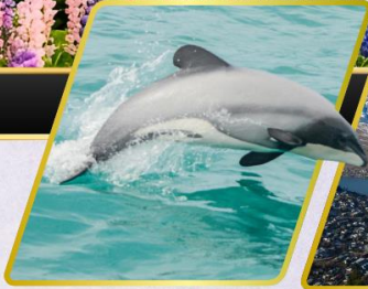
ล่องเรือชมปลาโลมา