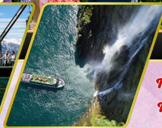
ล่องเรือมิลฟอร์ด ซาวัน