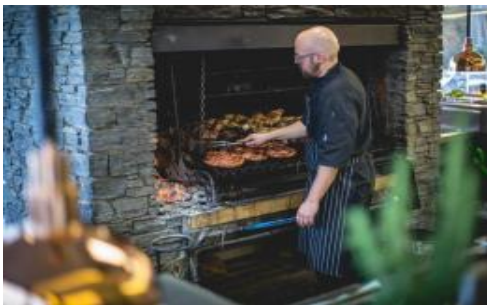
รับประทานอาหารกลางวัน บาร์บีคิว ณ วอลเตอร์พีคฟาร์ม