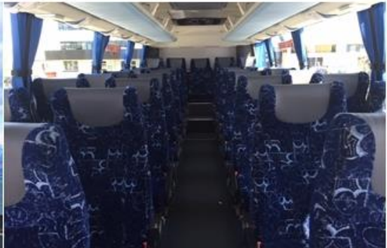
* ลุก้าจำนวน 15 ท่านขึ้นไป ใช้รถบัสขนาด 30 - 35 ที่นั่ง*