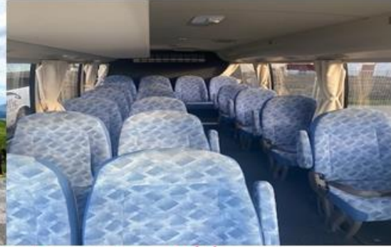
* ลुक้าจำนวน 10 - 14 ท่าน ใช้รถบัสขนาด 19 - 21 ที่นั่ง*