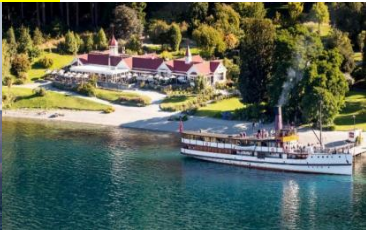
กลางวัน รับประทานอาหารกลางวัน บาร์บีคิว ณ วอลเตอร์พีคฟาร์ม