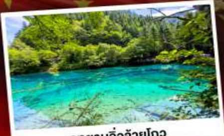
อุทยานจ๋องจ๋ายโกว