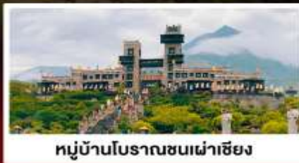
หมู่บ้านโบราณชนเผ่าเซียง