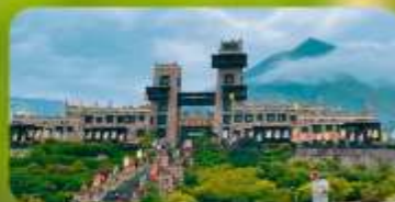
หมู่บ้านโบราณชนเผ่าเซียง