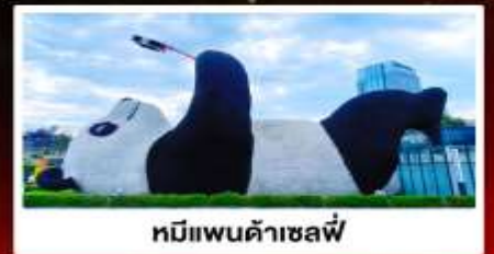
หมีแพนด้าเซลฟี่