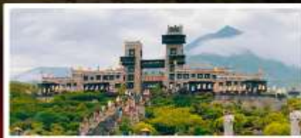
หมู่บ้านโบราณชนเผ่าเซียง