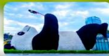
หมีแพนด้าเซฟี่