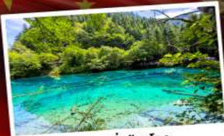
อุทยานจิ้งจายโกว