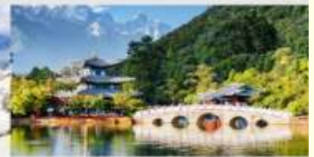
สระมิงกรต้า

*ทางบริษัทฯ ขอสงวนสิทธิ์ในการสลับโปรแกรมทัวร์ตามความเหมาะสมขึ้นอยู่กับสถานการณ์หน้างาน โดยคำนึงถึงผลประโยชน์ของลูกค้าเป็นสำคัญ