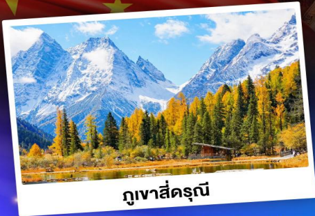
กูเงาสีดรุณี

ชมบรรยากาศใบไม้เปลี่ยนสี "สถานที่ท่องเที่ยว 5A อุทยานจิ๋วจ้ายโกว"