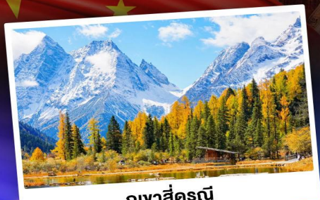
กู๋เงาสื่อรุณี

"สถานที่ท่องเที่ยว 5A อุทยานจิ๋วจ้ายโกว"