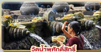
วัดน้ำพุศักดิ์สิทธิ์