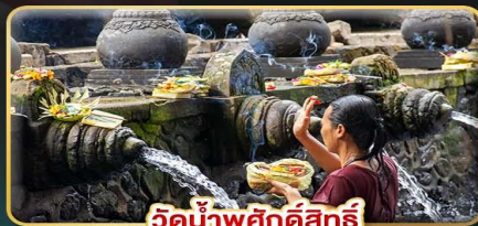
วัดน้ำพุศักดิ์สิทธิ์