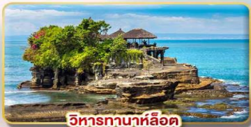
วิหารทานาห์ลอด