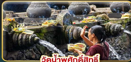
วัดน้ำพุศักดิ์สิทธิ์