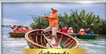
นั่งเรือกระด้ง

ROLIVA HOTEL 4* หรือเทียบเท่ามาตรฐานเวียดนาม