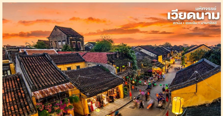
มหัศจรรย์ เวียดนาม ดานัง • ฮอยอัน • บานาฮิลล์

เมืองฮอยอันนั้นอดีตเคยเป็นเมืองท่า การค้าที่สำคัญแห่งหนึ่งในเอเชียตะวันออกเฉียงใต้และเป็นศูนย์กลางของการแลกเปลี่ยนวัฒนธรรมระหว่างตะวันตกกับตะวันออกองค์การยูเนสโกได้ประกาศให้ฮอยอันเป็นเมืองมรดกโลกทางวัฒนธรรมเนื่องจากเป็นสถานที่สำคัญทางประวัติศาสตร์ แม้ว่าจะผ่านการบูรณะขึ้นเรื่อยๆแต่ก็ยังคงรูปแบบของเมืองฮอยอันไว้ได้