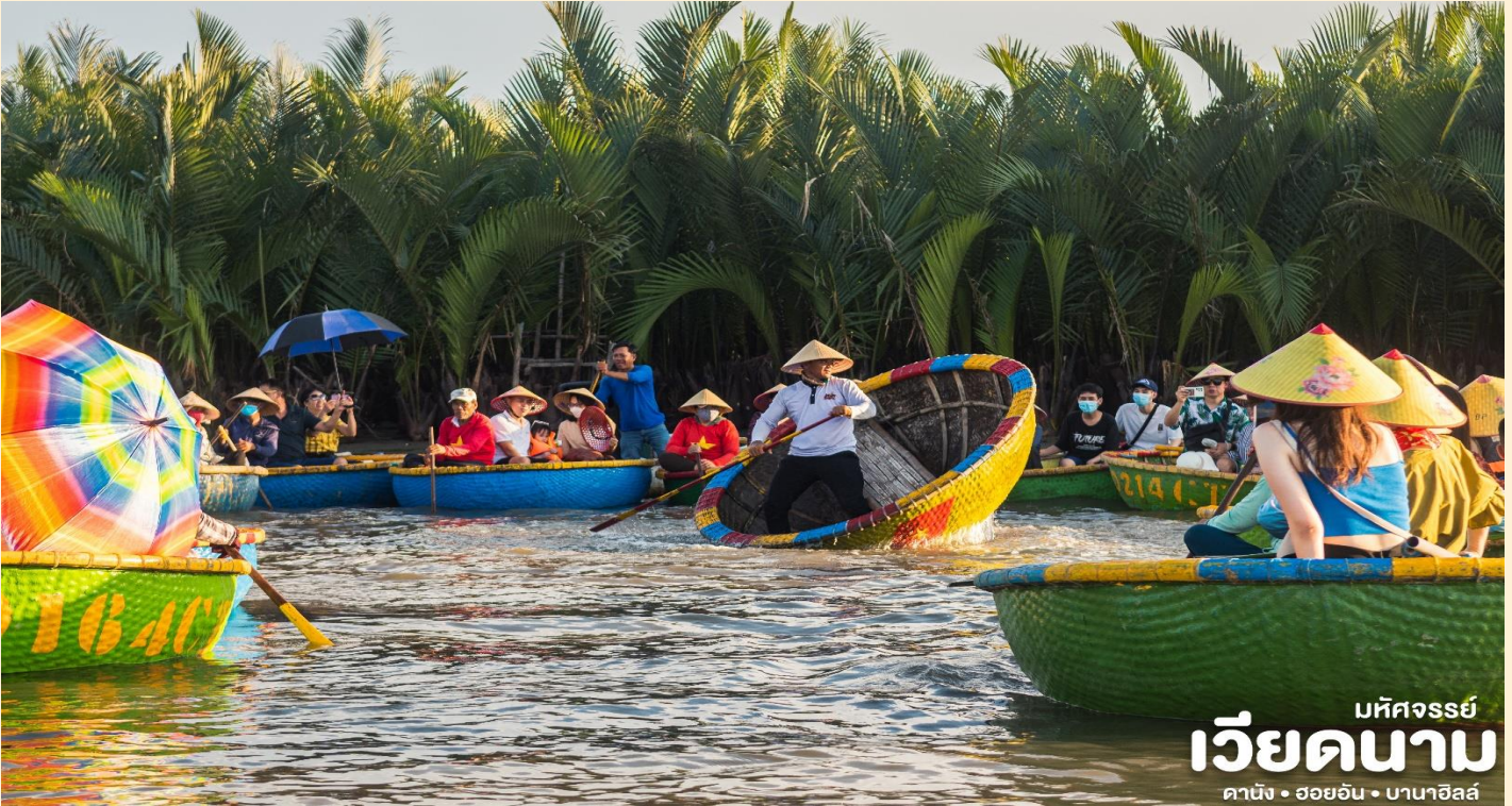
มหัศจรรย์ เวียดนาม ดานัง • ฮอยอัน • บานาฮิลล์

BT-DAD42_EK_JUN - SEP 2026 DANANG HOIAN BANAHILLS (เที่ยวบานาฮิลล์)