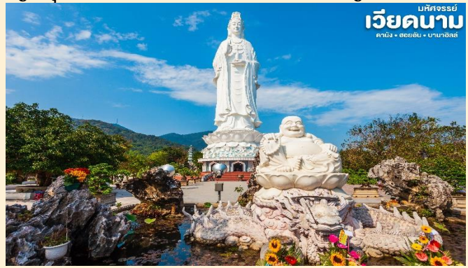
เวียดนาม บริษัทจรรยา คานัง • ฮอยอัน • บานาฮิลล์

สักการะ วัดลินห์อึ้ง (Linh Ung) เป็นวัดที่ใหญ่ที่สุดของเมืองดานังภายในวิหารใหญ่ของวัดเป็นสถานที่บูชาเจ้าแม่กวนอิมและเทพองค์ต่างๆตามความเชื่อของชาวบ้านแถบนี้ นอกจากนี้ยังมีรูปปั้นปูนขาวเจ้าแม่กวนอิมซึ่งมีความสูงถึง 67 เมตรตั้งอยู่บนฐานดอกบัวกว้าง 35 เมตรยื่นหันหลังให้ภูเขาและหันหน้าออกทะเลคอยปกป้องคุ้มครองชาวประมงที่ออกไปหาปลา นอกชายฝั่งวัดแห่งนี้นอกจากเป็นสถานที่ศักดิ์สิทธิ์ที่ชาวบ้านมากราบไหว้บูชาและขอพรแล้วยังเป็นอีกหนึ่งสถานที่ท่องเที่ยวที่สวยงามเป็นอีกหนึ่งจุดชมวิวที่สวยงามของเมืองดานัง และแวะให้ท่านเลือกชมและซื้อของฝากเป็นที่ระลึกที่ ร้านเยื่อไผ่