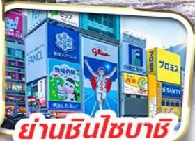
ย่านชินไซบาชิ