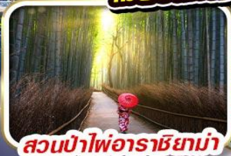
สวนป่าไฟอาราชิยาม่า

อิสระเต็มวัน เลือกซื้อแพ็คเกจ! UNIVERSAL STUDIO JAPAN