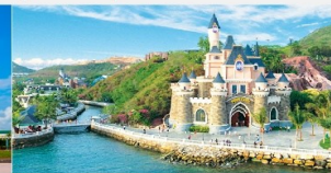
สวนสนุกวันเดอร์ส

*ทางบริษัทฯ ขอสงวนสิทธิ์ในการสลับโปรแกรมทัวร์ตามความเหมาะสมขึ้นอยู่กับสถานการณ์หน้างาน โดยคำนึงถึงผลประโยชน์ของลูกค้าเป็นสำคัญ