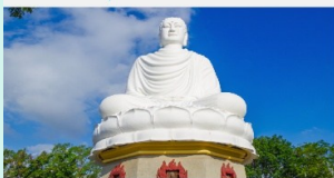
วัดลองเซิน