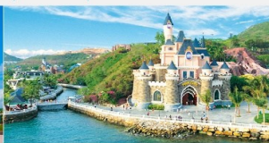
สวนสนุกวินวันเดอร์ส

*ทางบริษัทฯ ขอสงวนสิทธิ์ในการสลับโปรแกรมทัวร์ตามความเหมาะสมขึ้นอยู่กับสถานการณ์หน้างาน โดยคำนึงถึงผลประโยชน์ของลูกค้าเป็นสำคัญ