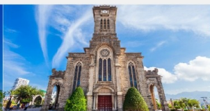
โบสถ์หินญูจาง