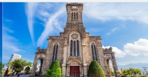
โบสถ์หินญาจาง