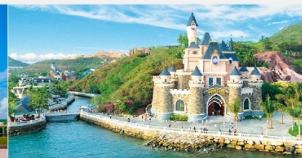
สวนสนุกวินวันเดอร์ส

*ทางบริษัทฯ ขอสงวนสิทธิ์ในการสลับโปรแกรมทัวร์ตามความเหมาะสมขึ้นอยู่กับสถานการณ์หน้างาน โดยคำนึงถึงผลประโยชน์ของลูกค้าเป็นสำคัญ