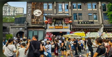
ถนนชอยกวางชอยแคม