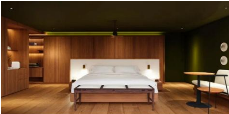
DECK 4 AMAZONIA CABIN (DECK 4)

ห้องพัก Upper Deck ชั้น 4 เป็นห้อง Suite room (มี 4 ห้องเท่านั้น ขนาด 35 ตร.ม.)