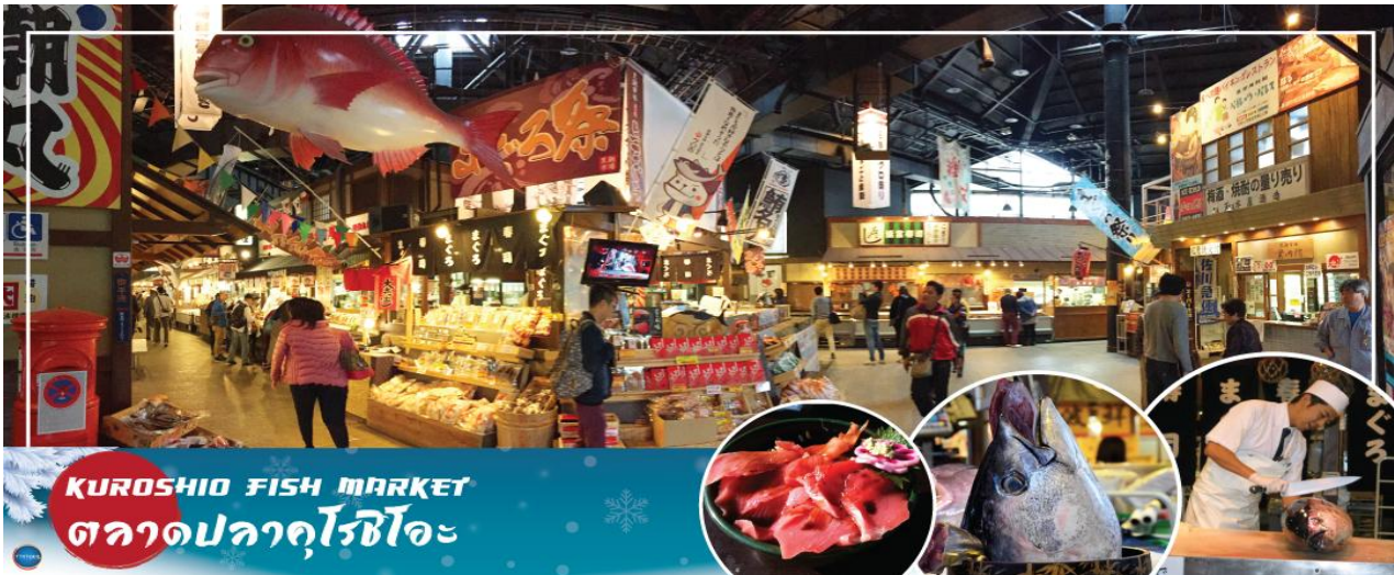
KUROSHIO FISH MARKET ตลาดปลาคุโรชิโอะ

วันที่สอง ท่าอากาศยานนานาชาติคันไซ โอซาก้า ประเทศญี่ปุ่น – เมืองวาคายามา – ตลาดปลาคุโรชิโอะ – นังรถไฟสุสานี่แมว (Wakayama St.- Kishi St.) – เมืองโอซาก้า – ศาลเจ้านัมมะยะซากะ