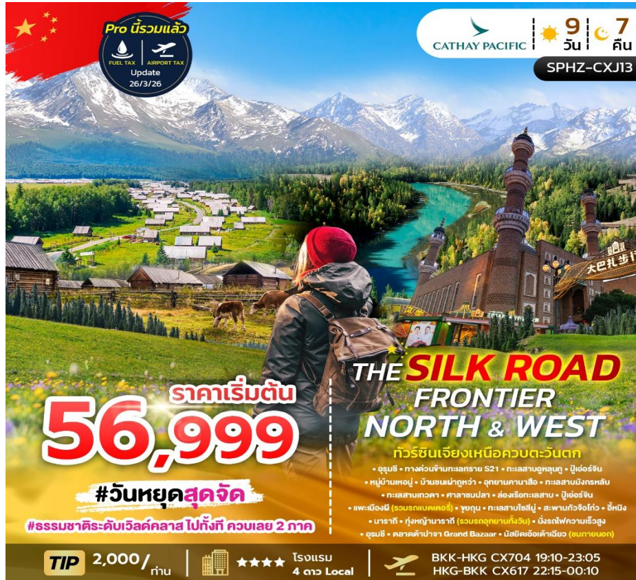
SPHZ-CXJ13 THE SILK ROAD FRONTIER – NORTH & WEST 9 วัน 7 คืน เดินทางด้วยสายการบิน Cathay Pacific (CX)