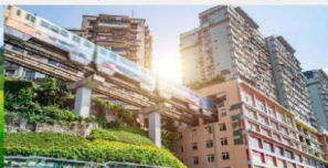
รถไฟฟ้าทะลุถ้ำ